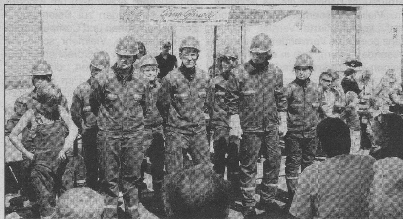
Die Jugendfeuerwehr Hattenheim ist derzeit gut aufgestellt.

nes Programm zur Unterhaltung zusammengestellt. So bot zum Beispiel die Geräteschau einen Einblick in die Arbeit der Wehr. Außerdem konnten die Gäste auf Wunsch eigene Feuerlöscher mitbringen und der zweijährigen Pflichtüberprüfung unterziehen lassen. Diese wurde gegen ein Entgelt von speziellem Fachpersonal durchgeführt. Eine Lösch- und Rettungsübung der Jugendfeuerwehr hielt die Gäste dann gegen Mittag in Atem. An-