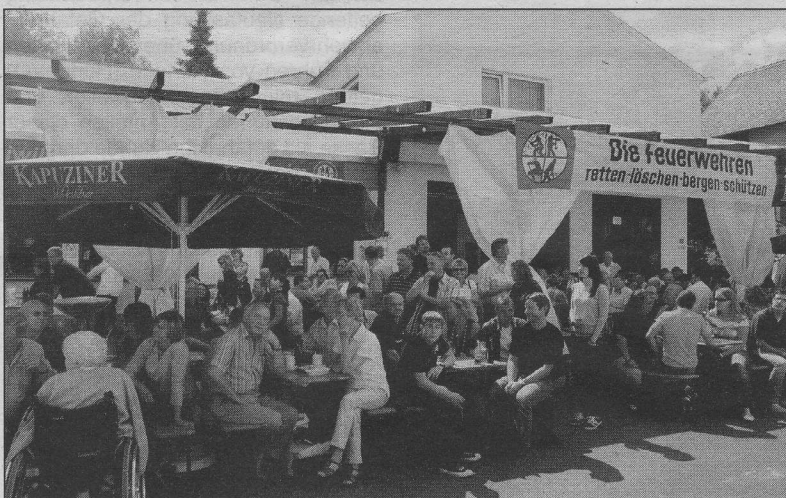
An beiden Tagen konnten die Mitglieder der freiwilligen Feuerwehr Hattenheim viele Gäste begrüßen.

„Tag der offenen Tür“ bei der Freiwilligen Feuerwehr Hattenheim